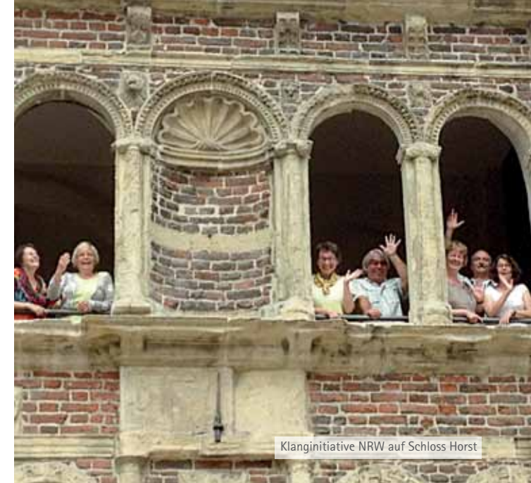
Klanginitiative NRW auf Schloss Horst

Genießen Sie eine schöne, klangvolle und erfüllende Zeit im Schloss Horst!